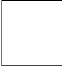
นางสาวมัสก๊ะ อาแว (รองประธาน)