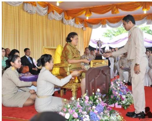
- รางวัลรองชนะเลิศอันดับ ๒ เกษตรกรปราดเปรื่อง