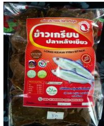
ข้าวเกรียบปลา