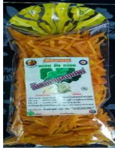
ข้าวเกรียบมันเทศ