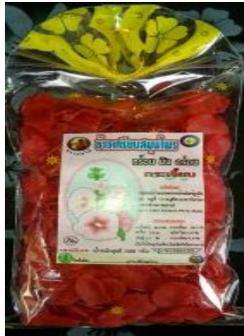
ข้าวเกรียบกระเจี๊ยบ