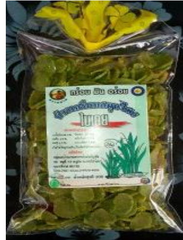
ข้าวเกรียบใบเตย