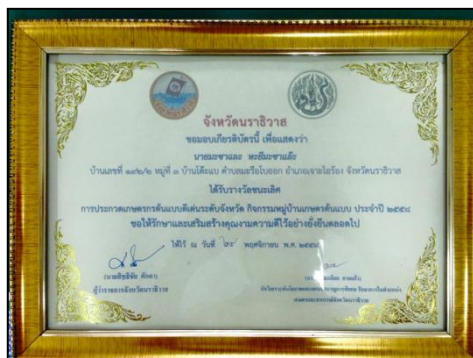
นายมะชาและ หะยิมะสาและ๊ะ

งานวันฉลองกอง ครั้งที่ ๔๐ ประจำปีพุทธศักราช ๒๕๕๘