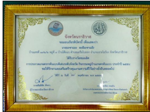
รางวัลชมเชยหมู่บ้านต้นแบบดีเด่น