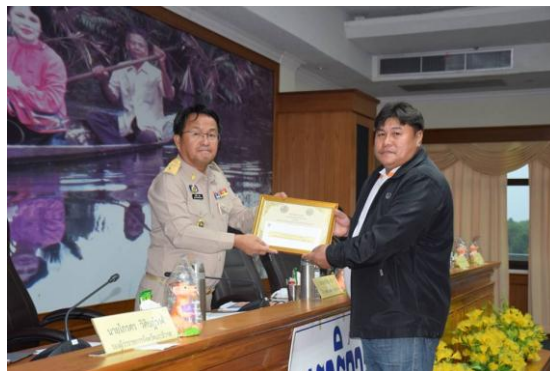
ความสำเร็จที่ภูมิใจ ปี ๒๕๕๘