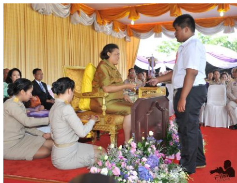
- รางวัลรองชนะเลิศ หมู่บ้านเกษตรต้นแบบ