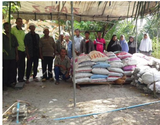
แจกปัจจัยการผลิต