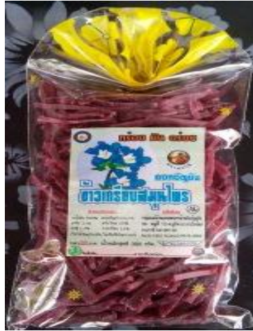
ข้าวเกรียบดอกอัญชัญ