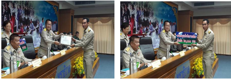
- รางวัลรองชนะเลิศอันดับ ๑ การประกวดสำนักงานเกษตรอำเภอดีเด่น -