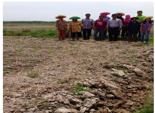
ติดตามผลการดำเนินงาน