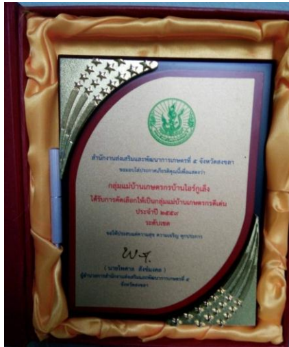
- รางวัลชนะเลิศที่ปรึกษายูวเกษตรกร