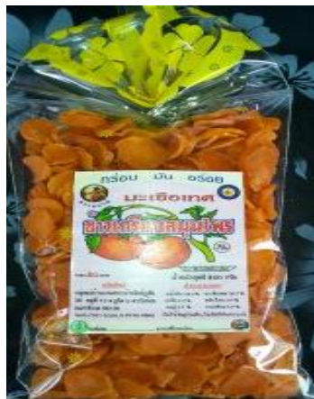
ข้าวเกรียบมะเขือเทศ